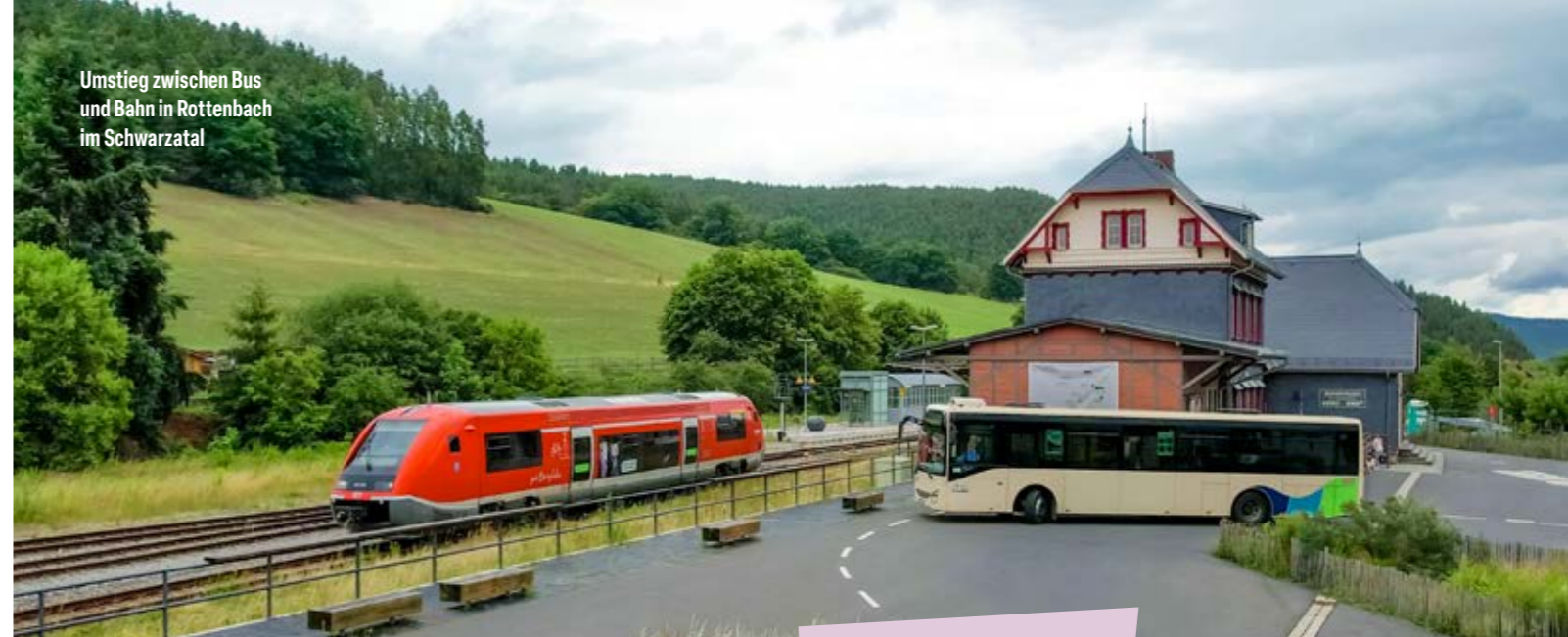
Umstieg zwischen Bus und Bahn in Rottenbach im Schwarzwald