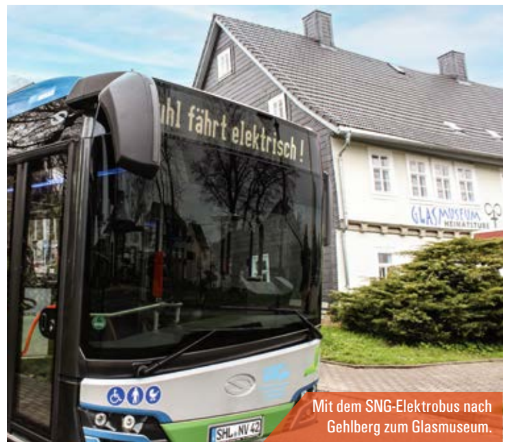
Mit dem SNG-Elektrobus nach Gohlis zum Glasmuseum.

Von Eisenach nach Bad Salzungen fährt der TaktBus der VUW-Linie 190. Aussteigen an der